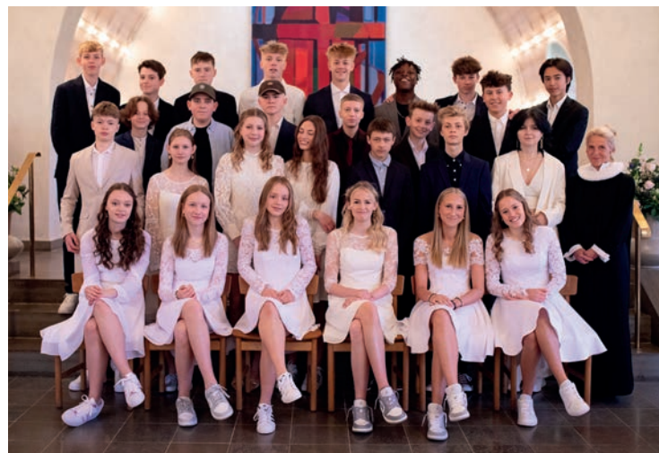
Fuglsanggårdsskolen 8A &amp; 8C