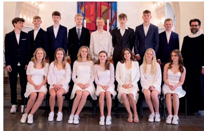
Virum Skole 8A