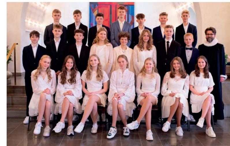
Virum Skole 8D