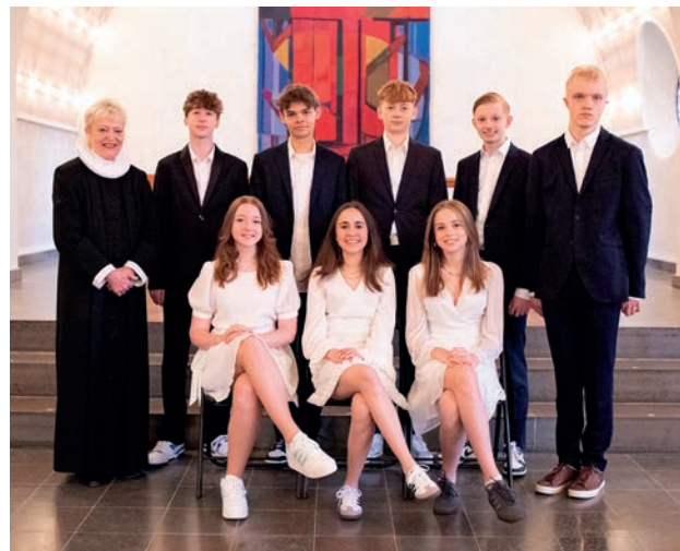
Virum Skole 8C

Årets konfirmationer løb af stablen d. 29. april samt 5. og 6. maj. Igen i år havde vi over 100 glade konfirmander fordelt på seks hold.