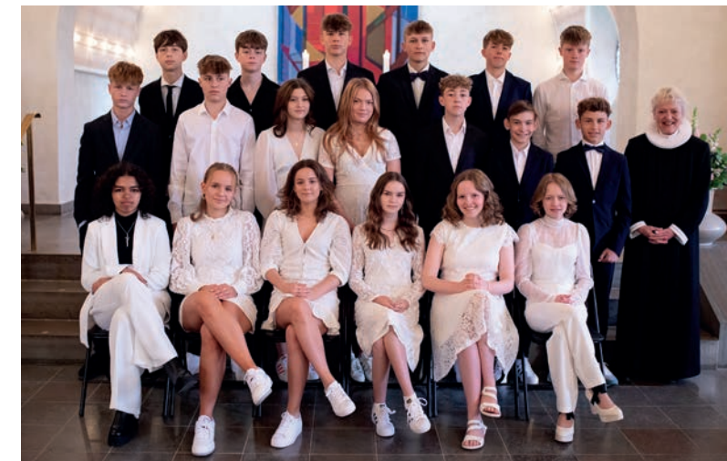
Virum Skole 8B